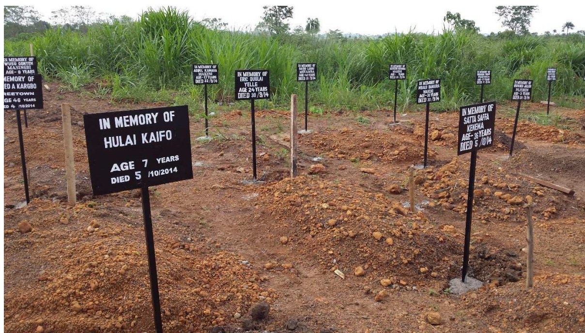
Tombes liées à Ebola, Sierra Leone