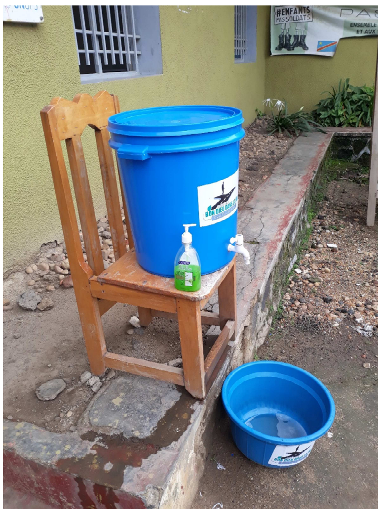
Système de lavage des mains dans le Nord Kivu, RDC

Les États ont quant à eux montré qu'ils ne s'intéressaient réellement à ces épidémies majeures et à ces pandémies que lorsqu'elles devenaient des risques pour leur sécurité et celles de leurs citoyens, ainsi que sur leur économie. La mobilisation internationale massive contre Ebola dans le Golfe de Guinée à la mi-2014, soit plusieurs mois après l'alerte et la montée exponentielle des courbes de personnes touchées et de décès, a été déclenchée par l'apparition des premiers cas aux États-Unis, en Europe et dans des pays abritant des Forces armées étrangères pouvant ramener le virus « à la maison », comme ce fut le cas lors de la grippe espagnole de 1918.