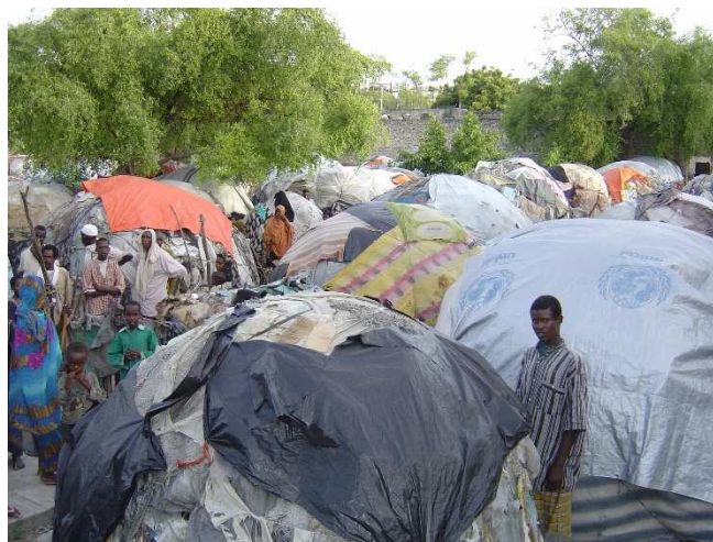
Camps de déplacés à Mogadisho, zone à haut risque de contagion

Dans de nombreuses opérations humanitaires classiques, les personnes déplacées ou les réfugiés sont abrités dans des camps qui sont souvent les principaux bénéficiaires des programmes de santé publique fournis par les agences d'aide. Toutefois, lorsque l'assistance sanitaire est fournie aux personnes déplacées, il est souvent nécessaire de l'étendre à la population environnante. En effet, la multiplication des centres de santé dans les camps où les populations urbaines voisines n'ont pas accès à des services de santé, est à la fois injuste et source de problèmes sanitaires et de sécurité. La situation est beaucoup plus complexe dans les contextes où un grand nombre de personnes déplacées vivent au milieu des populations, souvent chez l'habitant, dans des habitats précaires, de toutes formes et dimensions, dans des zones à forte densité habitées par des populations pauvres.