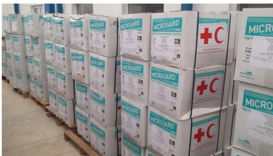
Stock de matériel de protection pour soignants lors de l'épidémie d'Ebola, Sierra Leone

La composante "logistique" de la gestion des grandes crises sanitaire est essentielle, car d'elle dépend à la fois les capacités de gestion des patients, le soutien au personnel médical, la mobilité dans les zones impactées, les options d'évacuation des malades.