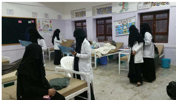
Centre de traitement du choléra de MSF au Yémen

Il est également important de prendre en compte que là où les situations rencontrées dans les cas d'épidémies sont sans solution de traitement, le personnel soignant est témoin de beaucoup de décès et se sent impuissant, ce qui est très difficile à gérer psychologiquement. Ceci est encore accentué par les mesures de confinement auxquelles ce personnel est souvent confronté lorsqu'il doit revenir chez lui. Les séquelles psychologiques peuvent être importantes pour des acteurs de la santé qui ont tout simplement l'impression de ne pas avoir été capables de soigner et de sauver.