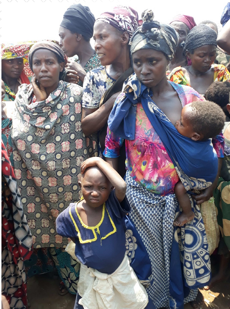
Familles dans un camp de déplacés du Nord Kivu en RDC

Les conflits sont des contextes particuliers dans le sens qu'ils tendent à augmenter considérablement le nombre de détenus et à faire enfler des populations carcérales qui vivent souvent dans des conditions d'incarcération déjà déplorables avant le conflit. Ces prisons peuvent très vite devenir des bombes à retardement où l'épidémie peut se développer très rapidement, toucher à la fois le personnel de la prison (qui devient lui-même un contaminateur pour sa famille et ses voisins) et toutes les personnes qui viendraient visiter les prisonniers. Les efforts de confinement renforcés pour lutter contre l'épidémie dans ces prisons deviennent aussi vite des sources de tension très importantes pouvant déboucher, si ces mesures ne sont pas prises, à des incidents de sécurité majeurs.