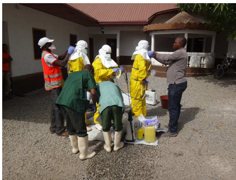
Préparation d'une équipe d'intervention Ebola dans un village de Guinée forestière

La crise Ebola a également entraîné une remise en cause de l'OMS, avec de fortes tensions entre l'institution et ses bailleurs, qui ont entraîné des réorganisations importantes de l'organisation pour être mieux à même de faire face à de tels défis.