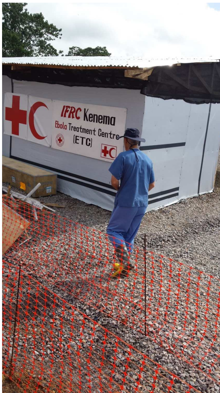
Centre de traitement d'Ebola de la Croix-Rouge, Kenema, Sierra Leone

Dans d'autres cas, ce sont les capacités logistiques, d'ingénierie (l'armée américaine au Libéria) ou de renforcement de la coordination (l'armée britannique en Sierra Leone) qui sont mobilisées. Dans un autre type de situation, comme à l'Est de la RDC, ce sont directement les Forces Armées de la RDC (FARDC), voire des milices de certains groupes armés qui ont été mobilisées, cette fois pour assurer la sécurité des campagnes de vaccination de l'OMS. Comme l'a démontré la situation dans les Kivus face aux pratiques des escortes dans la réponse à Ebola, les dérives ont été nombreuses et portent un potentiel fort d'affecter de façon globale l'intégrité de l'aide dans la zone et le respect des principes humanitaires en zone de conflit. Pour faire face à ce risque, il faut assurer que les bureaux d'OCHA soient dotés de capacités CIM-Coord suffisantes.