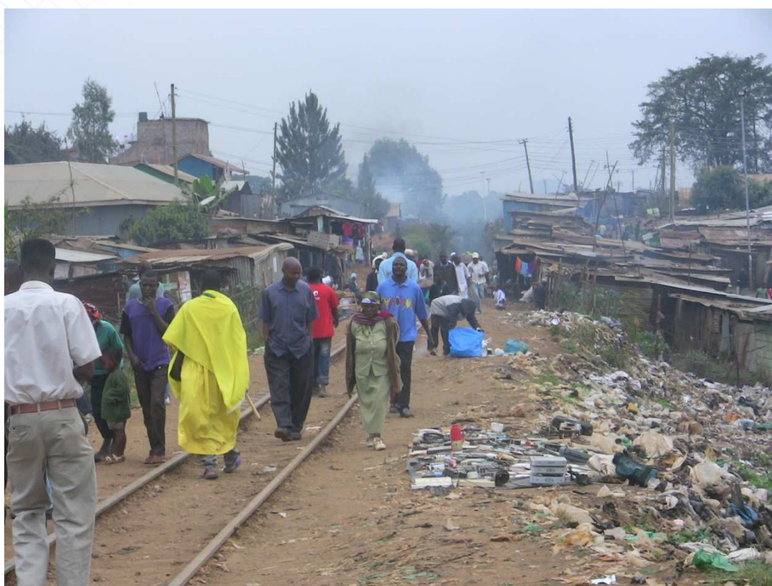
Bidonville de Conakry, zone à haut risque de contagion

L'urbanisation accélérée des dernières décennies a en effet fait apparaître de nouveaux dangers. Les conditions sanitaires dans un bidonville, dans une ville touchée par la guerre ou une catastrophe, représentent une menace majeure en raison des défis combinés de la taille et de la densité de la population qui sont les deux variables clés d'une « équation de contamination ». Là encore, le mode de contagion (lié à des vecteurs transmis par l'eau ou à des processus aérosols créent des dynamiques de contagions assez différentes qui demandent à la fois des efforts communs (lavage de main, etc.) mais aussi spécifiques (notamment la distanciation physique et le port éventuel de masques)