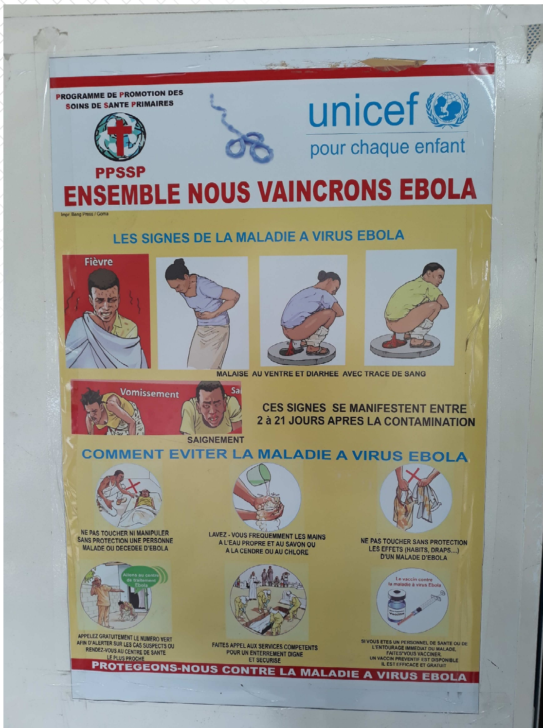
Affiche pour la prévention de la contamination du virus Ebola à Goma, RDC