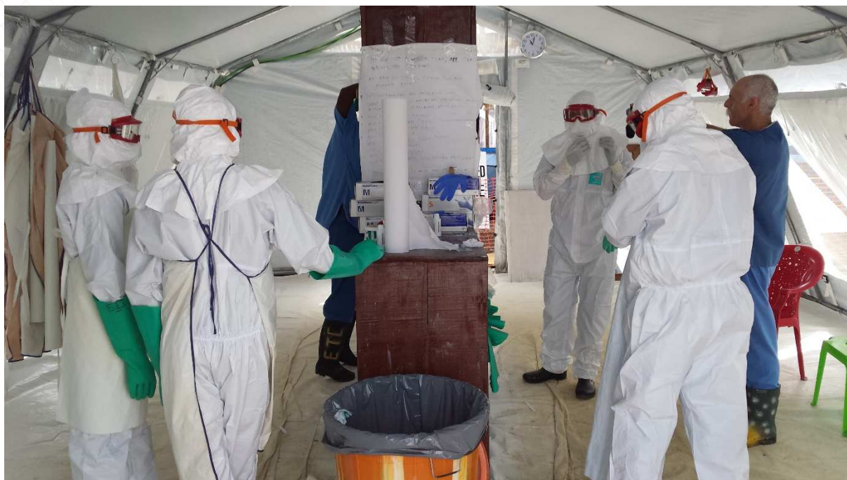
Briefing des équipes avant l'entrée en zone contaminée, Kenema, Sierra Leone

Certes, des expertises locales se sont développées au fur et à mesure que des épidémies se déclenchaient et que des réponses étaient mises en place. Il faut imaginer comment les soutenir au mieux.