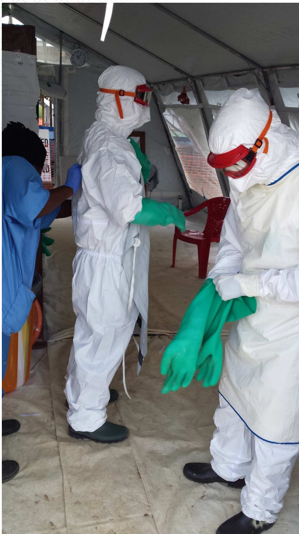
Sas d'entrée dans la zone contaminée d'un centre de traitement Ebola à Kenema, Sierra Leone