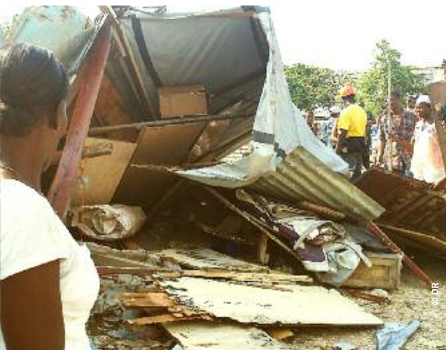
À gauche : Expulsions forcées au camp Mozayik, dans la commune de Delmas (agglomération de Port-au-Prince), en mai 2012.