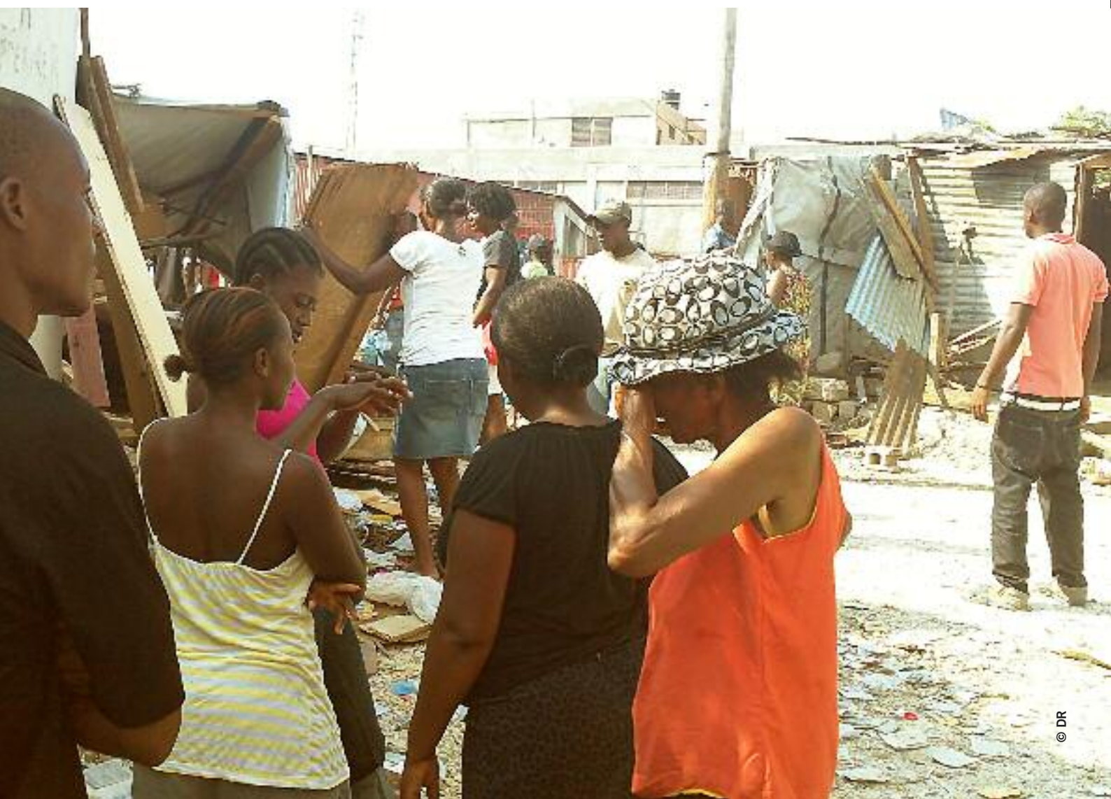
Ci-dessous : Des habitants du camp Mozayik assistent à la destruction de leurs logements, après des expulsions forcées, dans la commune de Delmas (agglomération de Port-au-Prince), en mai 2012.